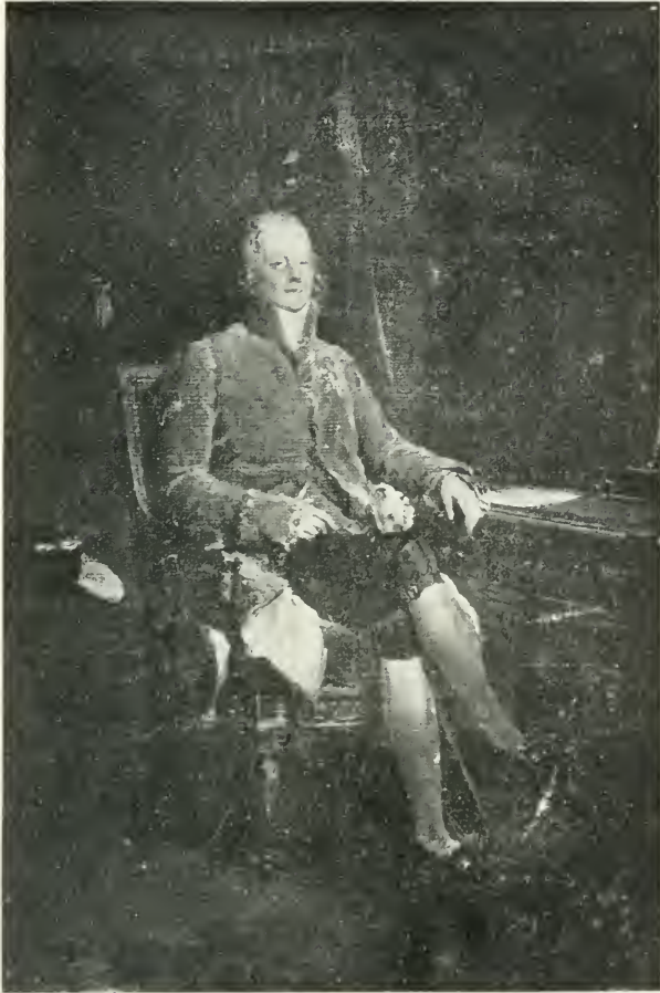
PORTRAIT DE TALLEYRAND, EN 1801